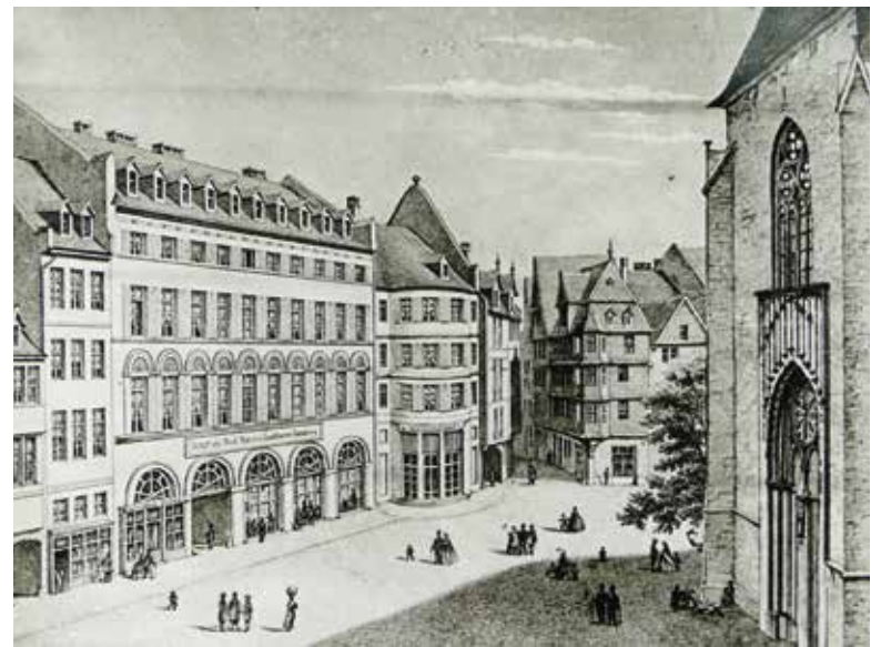
Domplatz mit der Jaeger'schen Buchhandlung Foto von M. Matthews nach einer Zeichnung, um 1835 16 x 21,7 cm Historisches Museum Frankfurt Ph13446