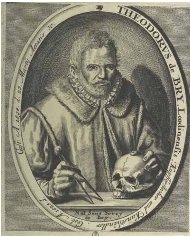
Theodor de Bry Kupferstich, anonym 19,0 x 15,4 cm Historisches Museum Frankfurt C12393