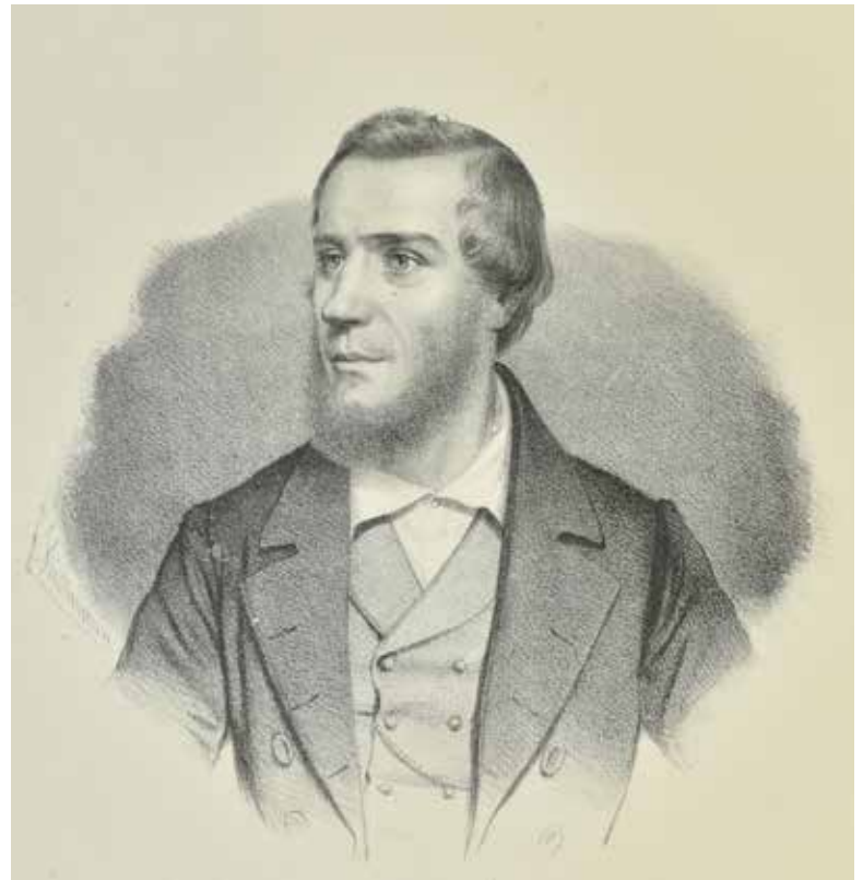
August Ravenstein Lithographie um 1885, nach einer Zeichnung von Angerer und Gröschl gedruckt von Ch. Reisser und M. Werthner 44 x 31 cm Historisches Museum Frankfurt C07341