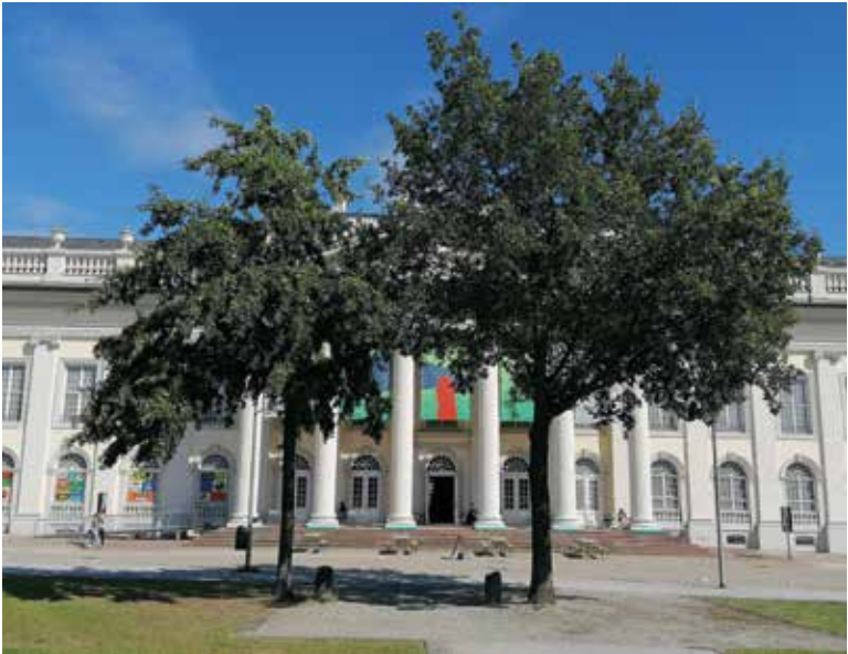
Der erste und der letzte Baum des Kunstwerks „7.000 Eichen“ von Joseph Beuys

Wer den Friedrichsplatz überquert, kommt mit dem Fridericianum am Herzstück jeder documenta vorbei. Und an documenta-Kunst, die man manchmal nicht auf den ersten Blick erkennt. Klar, die zwei noch relativ jungen Eichen mit der Basaltstele, das ist natürlich Joseph Beuys. Kein anderer Künstler hat so oft an der documenta teilgenommen, kein anderer hat Kassel so geprägt – und kein anderer hat für so hitzige Debatten gesorgt. Es war ja beileibe nicht so, dass die heimische Bevölkerung durchgängig begeistert war vom Großprojekt „ 7.000 Eichen “ (1982) und der Stadtverwaltung.