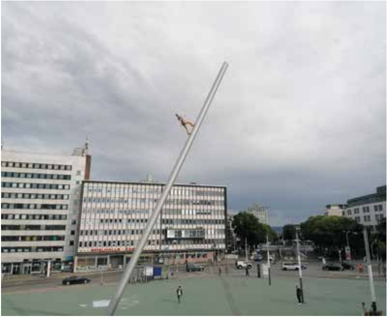
Der Himmelsstürmer vor dem Kulturbahnhof

Kunst in der Bevölkerung. Für den Himmelsstürmer haben 1992 viele gespendet. Manch einer hat heute noch einen Satz Telefonkarten mit dem Foto des Himmelsstürmers irgendwo im Schrank. Praktisch nutzlos, aber eine schöne Erinnerung. Einer der Großspender damals war der Mann, nach dem der Vorplatz benannt ist: Rainer Dierichs, der frühere Verleger der Tageszeitung HNA.