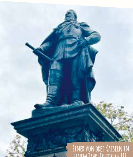
EINER VON DREI KÄISERN IN EINEM JAHR: FRIEDRICH III.

Das zugehörige Sternerrestaurant ENTE VON LEHEL zieht in der Zwischenzeit nach Kloster Eberbach im