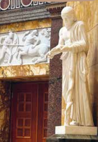
KOPLEN IM KURHAUS-FOYER – AUCH BEEINDRUCKEND

Beim Verlassen des Kurhauses erscheint rechts die unter Denkmalschutz stehende KONZERTMUSCHEL . Einst täglich von einem vierzig Mann starken Kurorchester bespielt, steht sie heute auf einem Konzertplatz mit ei-