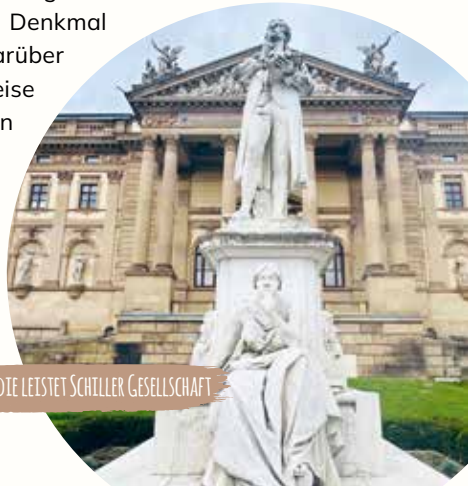
DIE TRAGGÖTTE LEISTET SCHILLER GESELLSCHAFT

Der weitere Spaziergang führt durch den Mitte des 18. Jahrhunderts angelegten WARMEN DAMM linkerhand des großen