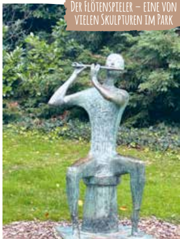
DER FLÖTENSPIELER – EINE VON VIELEN SKULPTUREN IM PARK

https://kurhaus.wiesbaden.de/kurpark/ Öffnungszeiten: Mai bis September tägl. von 5 – 23 Uhr, Oktober bis April tägl. 5 – 20 Uhr Bootsverleih in Sommermonaten und bei passendem Wetter Mi. – Fr. 15 – 18 Uhr, Sa., So., Feiert. 11 – 18 Uhr, Bootsverleih Schmitz Tel.: 01522-6213899