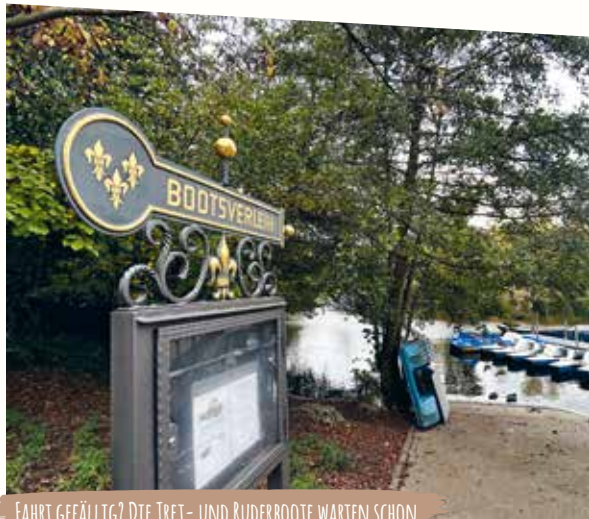
FAHRT GEFÄLLIG? DIE TRET- UND RUDERBOOTE WARTEN SCHON