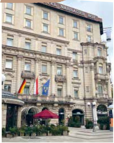
GRAND HOTEL NASSAUER HOF