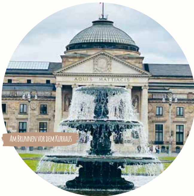
AM BRUNNEN VOR DEM KURHAUS

Rheingau. Die Stammgäste der legendären Hotelbar müssen sich indes nach neuen nächtlichen Treffpunkten umschauen. Wir überqueren die auch »Rue« genannte noble Wilhelmstraße, auf der ein überdurchschnittliches Aufkommen hochpreisiger Autos völlig normal ist, und schauen über die große Rasenfläche des BOWLING GREEN mit seinem 170 Jahre alten Kaskadenbrunnen hinweg auf das KURHAUS .