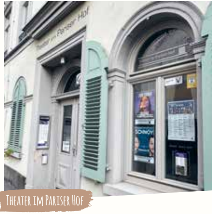
THEATER IM PARISER HOF

te – mehrfach zerstört und wiederaufgebaut – genutzt.