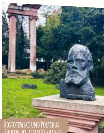
DOSTOJEWSKI UND PORTIKUS – SÄULEN DES ALTEN KURHAUSES