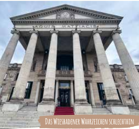
DAS WIESBADENER WAHRZETZEN SCHLECHTHIN