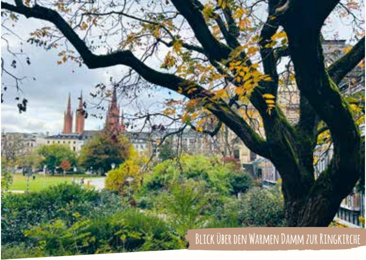
BLICK ÜBER DEN WARMEN DAMM ZUR RINGKIRCHE

ser hatte natürlich einen Shuttleservice ins Theater. Der Weg zum Ziel, von der heutigen Paulinenstraße bis zur Wilhelmstraße, war mit Kerzen beleuchtet. Unter dem Foyer hindurch brachte die Kutsche seine Majestät bis zum Kaisertreppenhause, das geradewegs in die Kaiserloge führte. Insignien der Macht am Tor von der Paulinenstraße her zeugen bis heute von der einst royalen Nutzung.